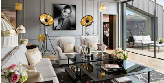
Salon / Studio Harcourt