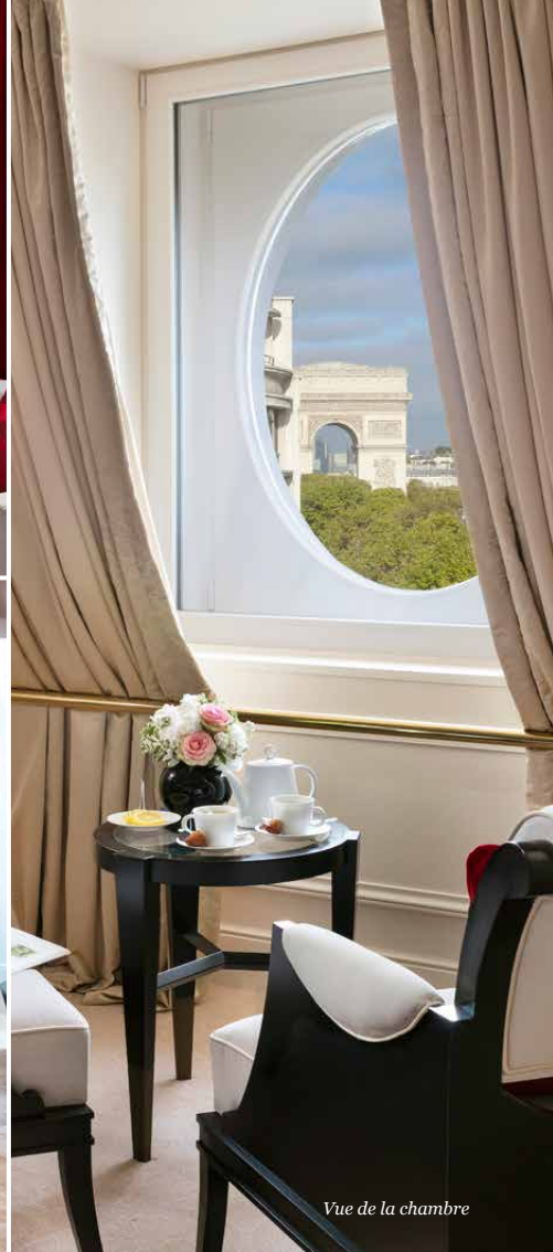
Vue de la chambre