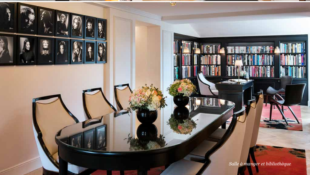
Salle à manger et bibliothèque