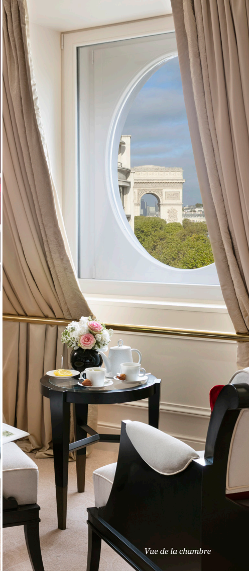
Vue de la chambre