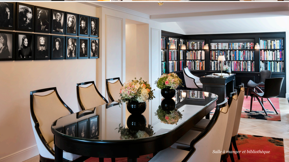
Salle à manger et bibliothèque