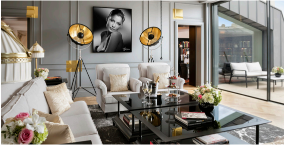
Salon / Studio Harcourt